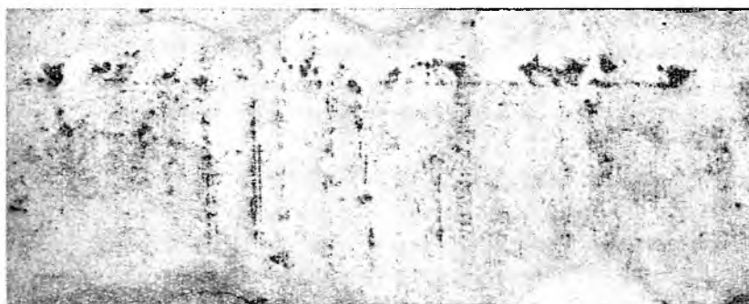
SOPA DE CARAOTAS NEGRAS