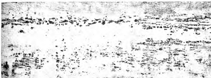
SOPA DE CARAOTAS BLANCAS

QUIMIOGRAFIAS DE LAS PAREDES DE LOS ENVASES QUE CONTENIAN SOPAS DE DIFERENTES VARIEDADES DE CARAOTAS (Después de 12 meses de almacenaje)