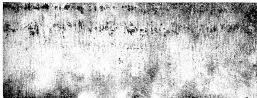
SOPA DE CARAOTAS ROJAS